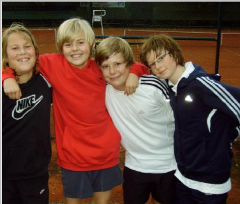
Unsere Jugend - Medenmannschaft